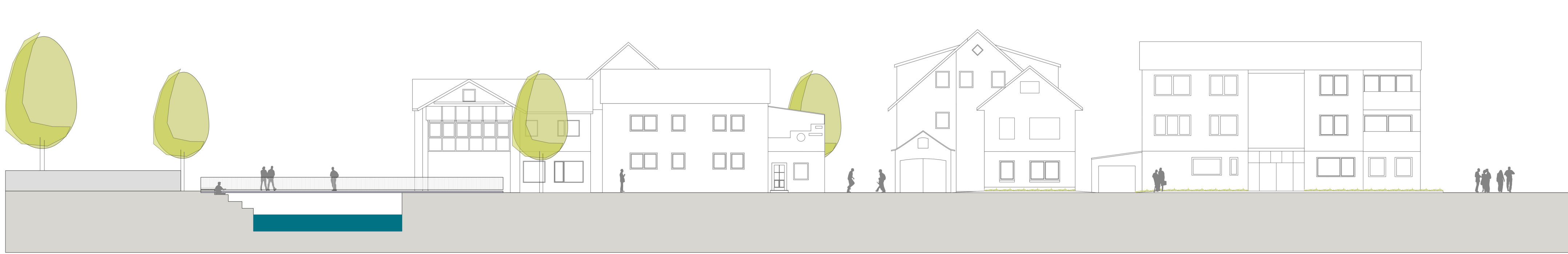
Schnitt 1 | M 1:200